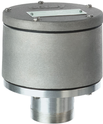
SP-H Holder (for 1–3 sensors)