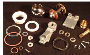
05934 Nozzle Rebuild Kit